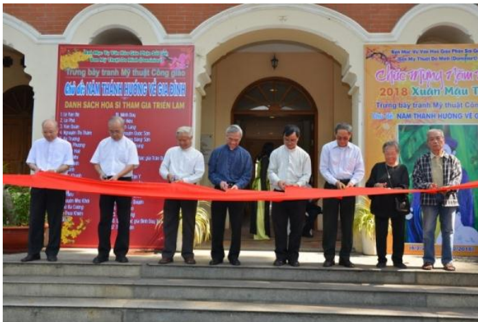
Trung bày tranh mỹ thuật Công giáo (6.2.2018)