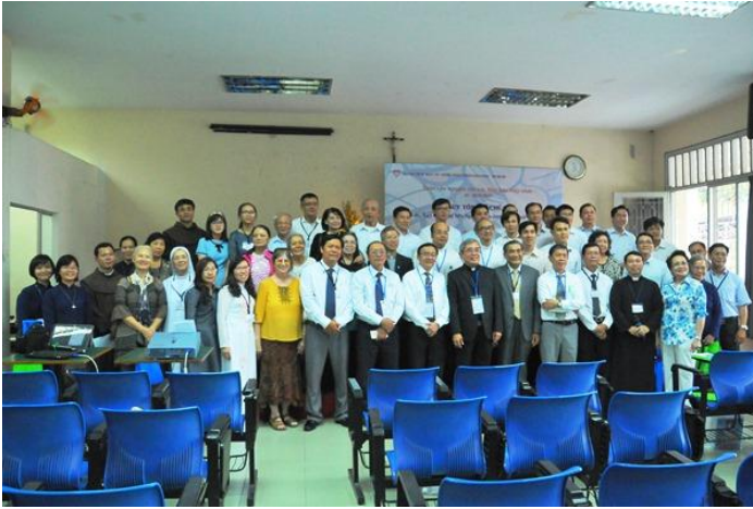
TTMV: Gặp gỡ Đại kết lần VI (24.1.2018)